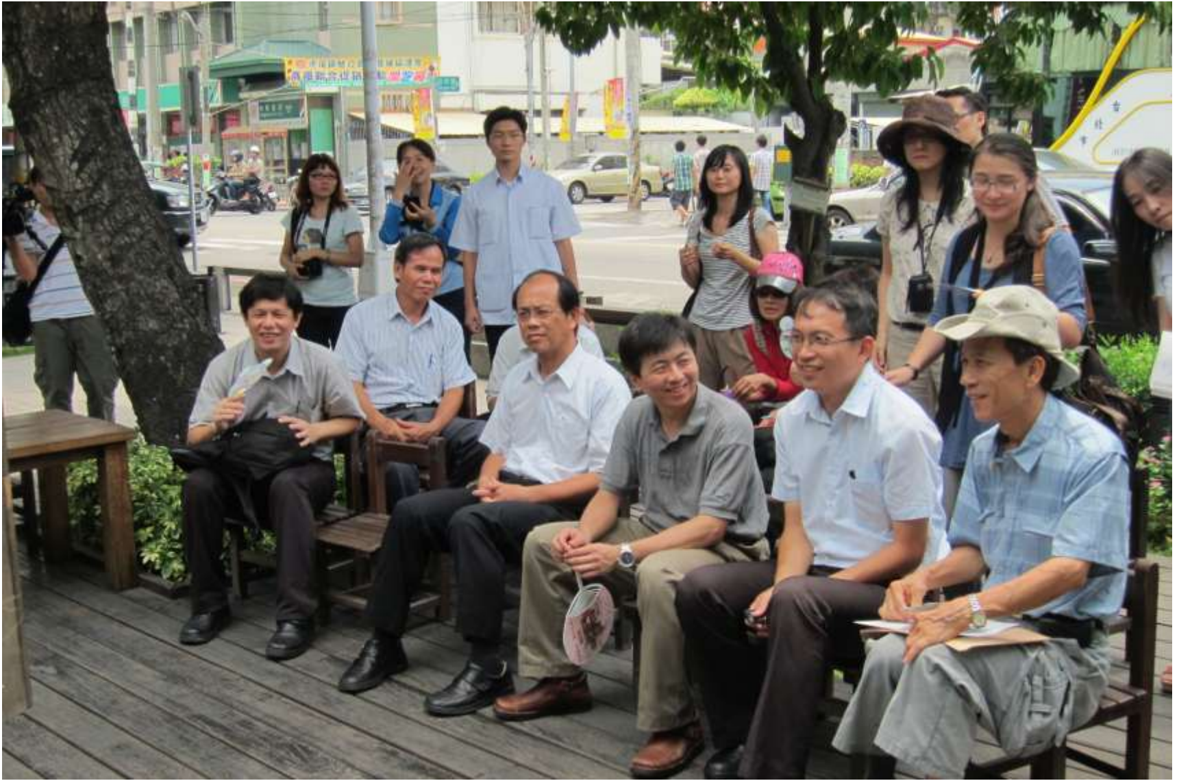
文建會主委盛治仁訪視雲林故事館