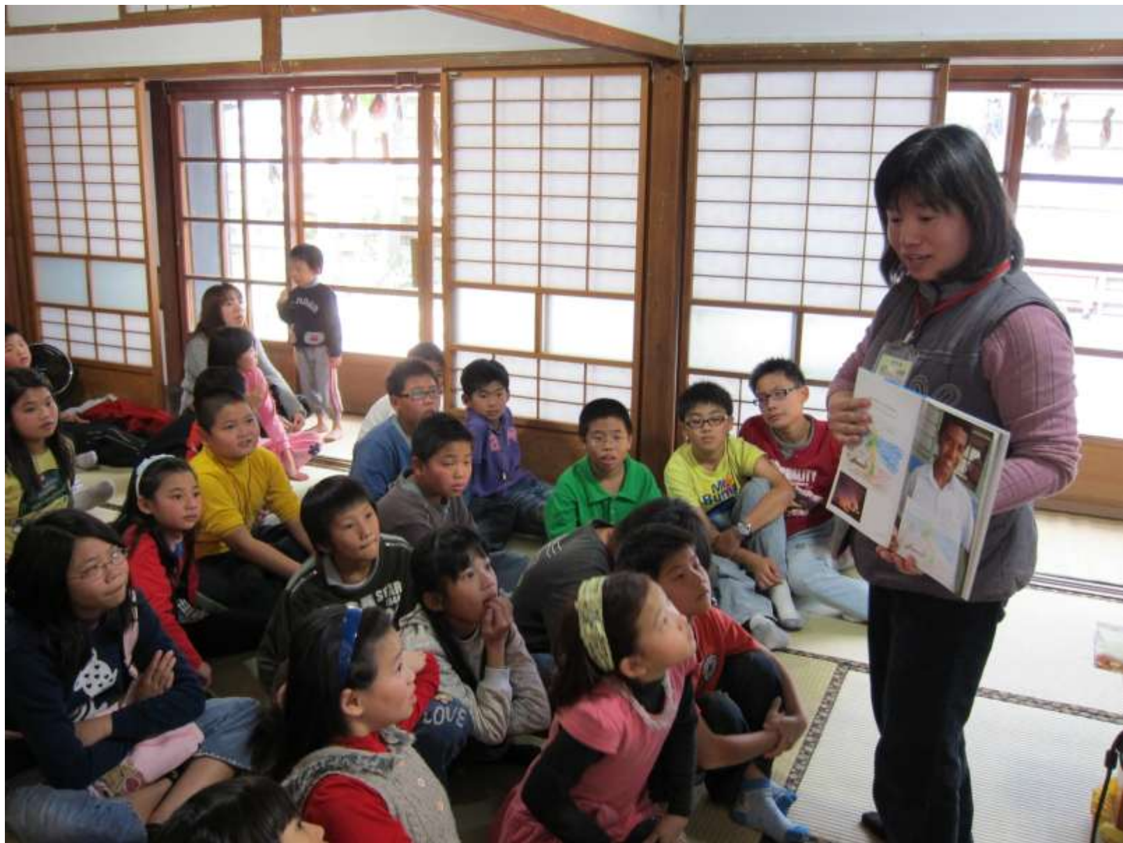
週三下午的兒童讀書會，帶領孩童共同討論多元議題