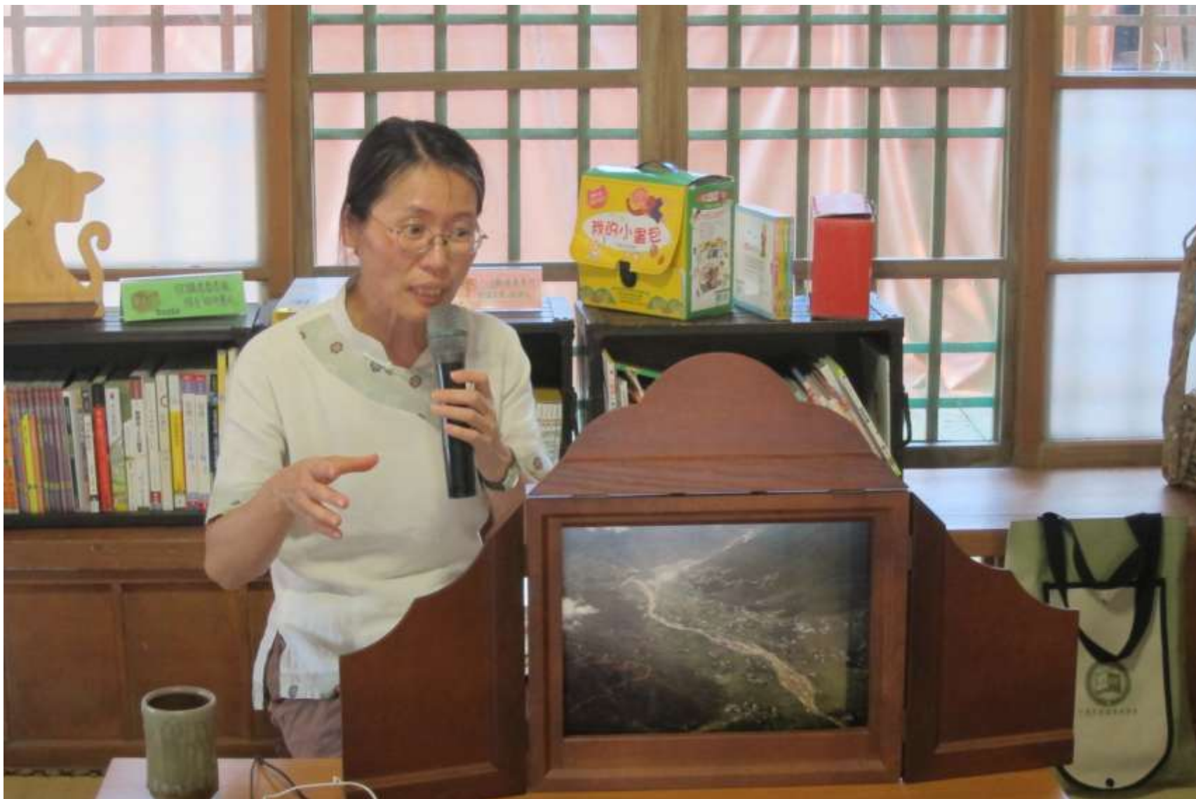
人才培育系列課程--文化推手培訓