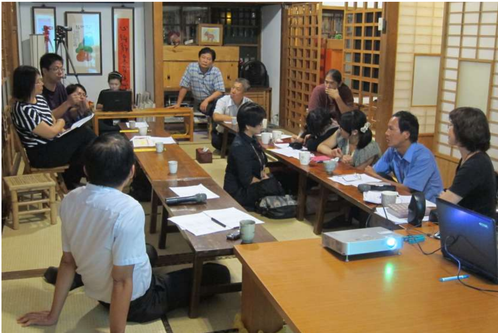
願景2020會議---一起討論虎尾公共議題