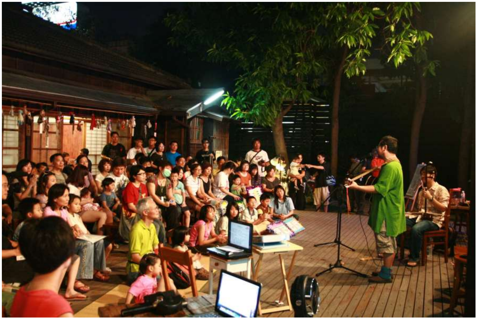
故事館後庭院，最適合喝杯音樂下午茶了