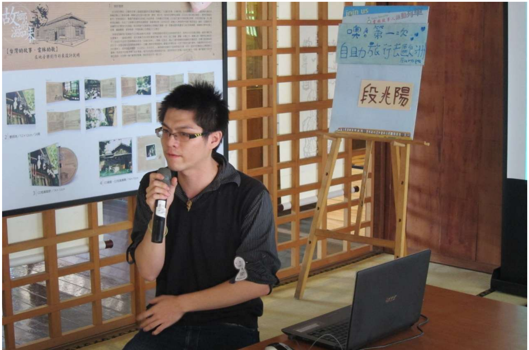
有夢最美一段兆陽同學分享自助旅行去歐洲的經驗