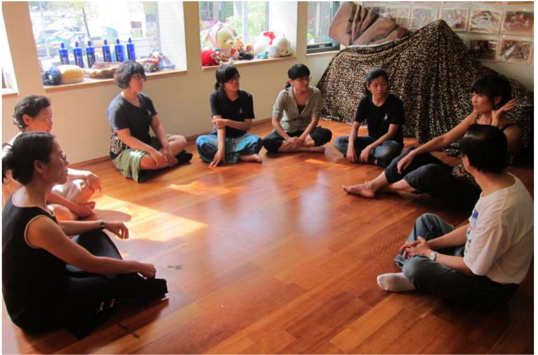
人才培育系列課程---肢體開發