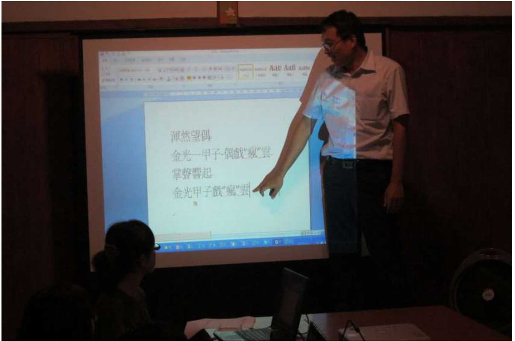
願景2020會議---一起表決國際偶戲節標題