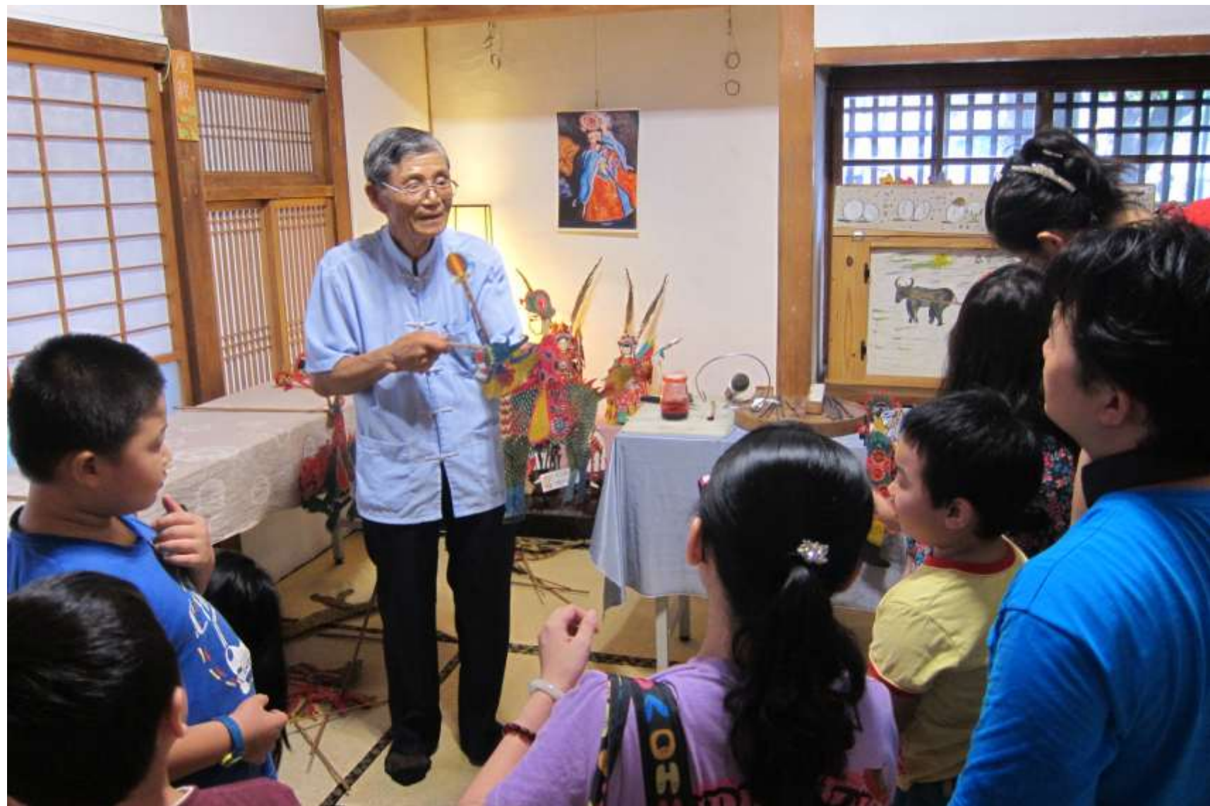
這次的皮影戲說演，也喚醒許多人的童年記憶